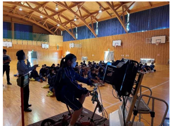
危険を回避しながらゴールを目指します