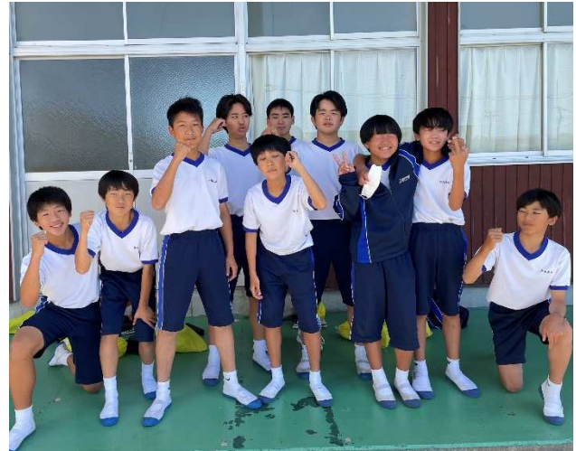
Team Kotaro 今回のメンバー