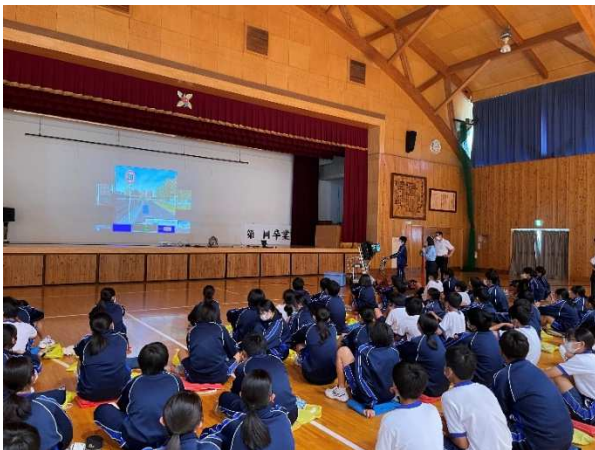
慣れないシュミレーターに悪戦苦闘

5月18日(木)の交通安全教室では、交通指導員から自転車のルールマナーについての話を聞きました。また、自転車シュミレーターを使用して、道路の危険箇所を再確認しました。自転車を使用するときは、被害者にも加害者にもなりうる立場にいます。自分の身を自分で守れるように、十分気を付けたいものです。