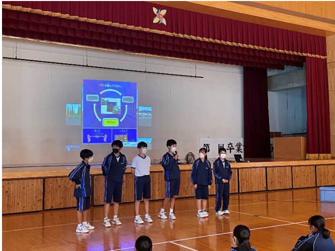
シュミレーター参加者の感想タイム