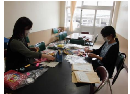
母親ボランティア

しかし、入野小学校は、すでにCSを設置する前から、保護者や地域の皆様から子供たちの活動につきまして、たくさんの御支援や御協力をいただいております。今年度も、母親ボランティアの皆様には、七夕飾りやクリスマスカードのプレゼントや校外学習での見守りを、入っ子サポーターの皆様には、夏休み入っ子広場や懇談会時の託児への御協力、地域の皆様には、登下校の見守り、マジッククラブやポッチャクラブでの御支援、3年生の総合的な学習での凧揚げ会の皆様のお話…。数え上げればきりがありません。