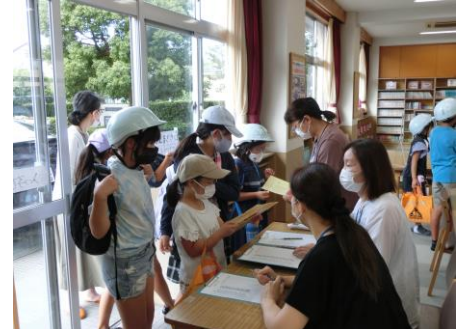
夏休み入っ子広場

このような活動を引き継ぎつつ、今後は、CSを効果的に活用しながら、「地域とともにある学校づくり」をさらに進めていきたいと考えております。